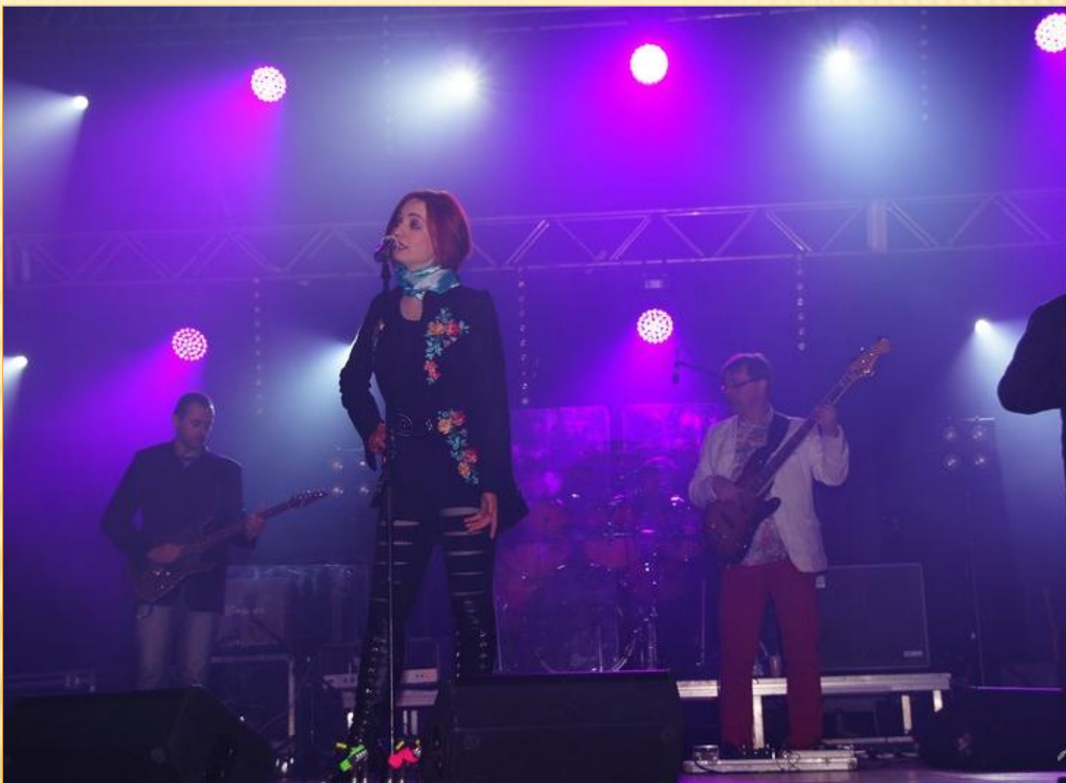
KONCERT ZESPOŁU BRATHANKI